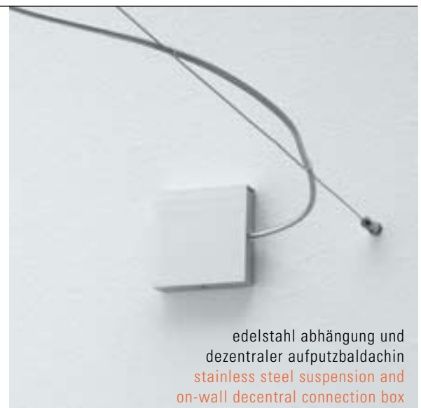
edelstahl abhängung und dezentraler aufputzbaldachin stainless steel suspension and on-wall decentral connection box